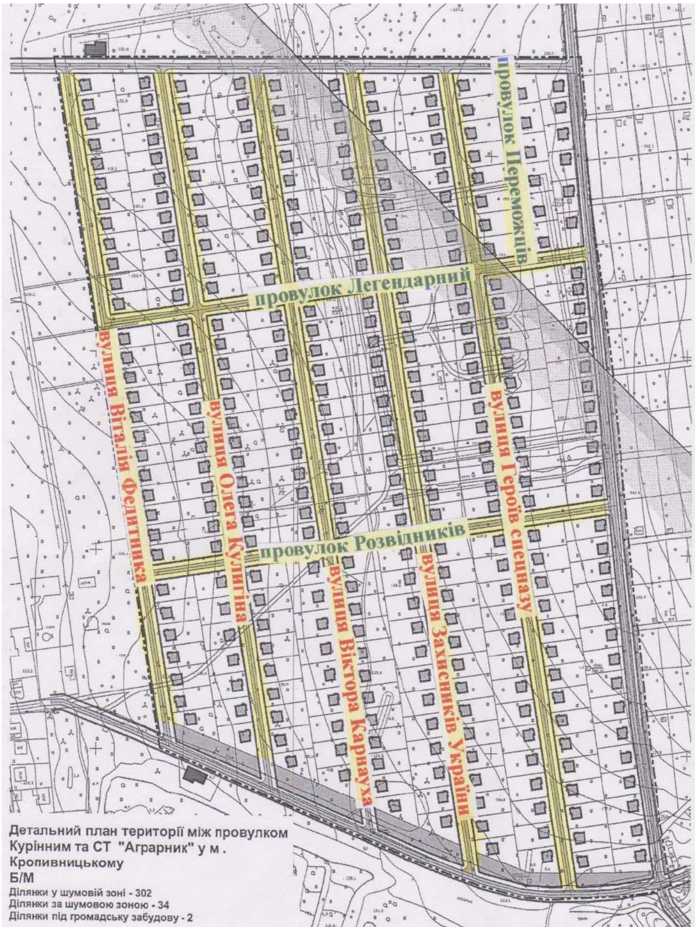
Схема запроектованих вулиць і провулків у житловому масиві в районі вулиці Козацької, провулка Козацького та провулка Курінного